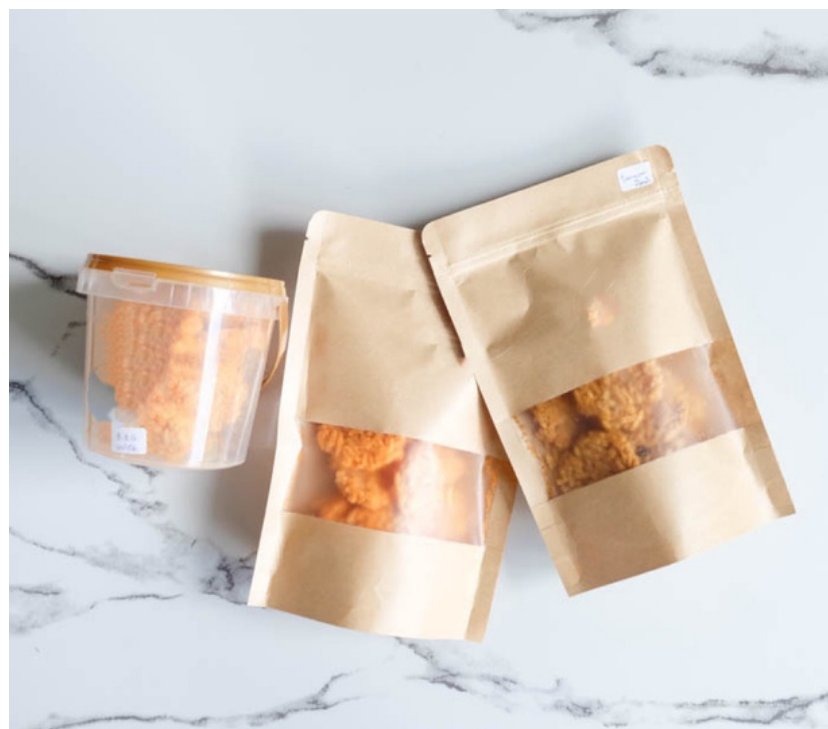
ธุรกิจข้าวกข.43 กรอบกรอบ